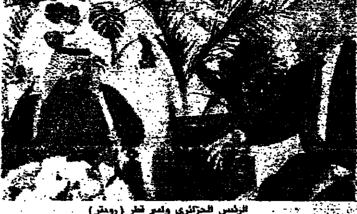
الرئيس الجزائري وامير قطر

الذي يقف الاستمرار. وقال ان المشكلات المتعلقة هي موضوع الاسرى وسط العربي وعدم فرض التفاوض على منطقة الخليج العربي وعدم التدخل في الشؤون الداخلية. وقال ردا على سؤال عن شكل الوحدة للامم للول العربية يبدو في ان شكل الوحدة للاتحاد العربي ولللامم العربية على التوالي. والوصول الى سلام حقيقي وحل جميع المشكلات